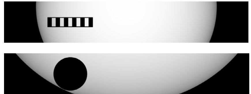
Figure 1 : En haut, un objet artificiel en transit devant une étoile de type solaire. La figure du bas représente la modélisation d'un transit planétaire ressemblant au mieux au transit artificiel. Les courbes photométriques de ces deux transits ne sont pas exactement identiques, comme le montre la figure suivante

Web: http://www.obs-hp.fr/~arnold/news_0504.html