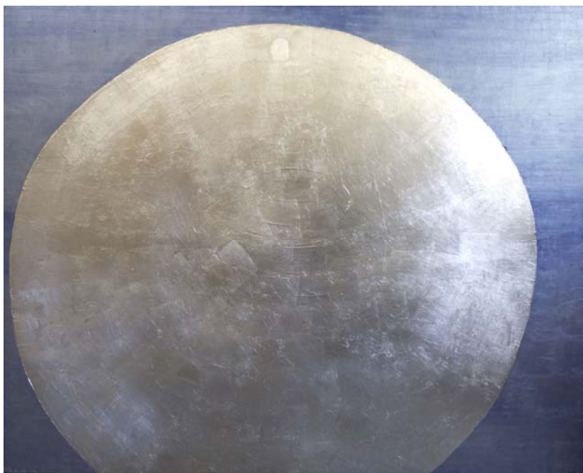
N°11-1968 - Grand rond – Vinylique et Feuille métal sur toile