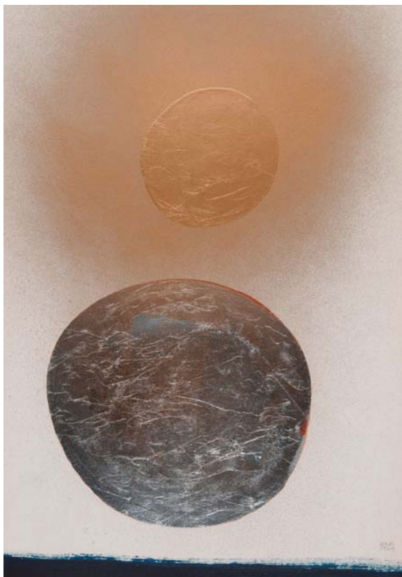
N°15-1969 – Vinylique, encre et Feuille métal sur papier