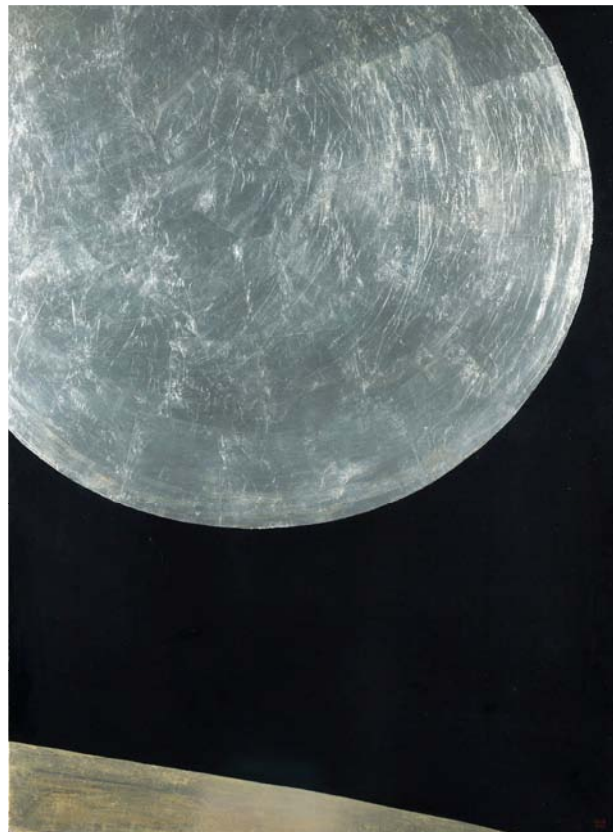
N°55-1969 - Autre terre, autre lune Vinylique et Feuille métal sur panneau de bois contre-plaqué