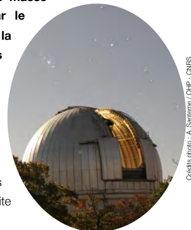
Vue de nuit de la grande coupole de l'Observatoire de Haute-Provence

Grâce à leur campagne, cette équipe d'astronomes 3 à découvert des objets de natures très différentes :