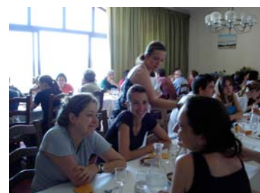
Salle de restaurant