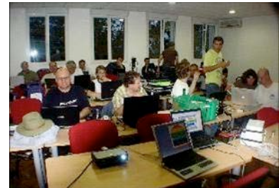
Salle de 30 places

Possibilité de pauses-café servies en salle de conférence ou à l'extérieur.