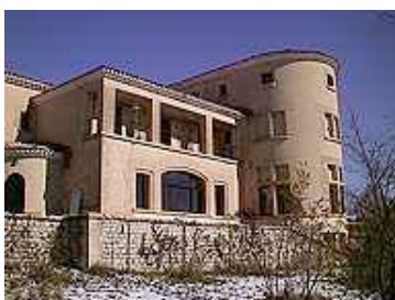
Maison d'hôtes Jean Perrin